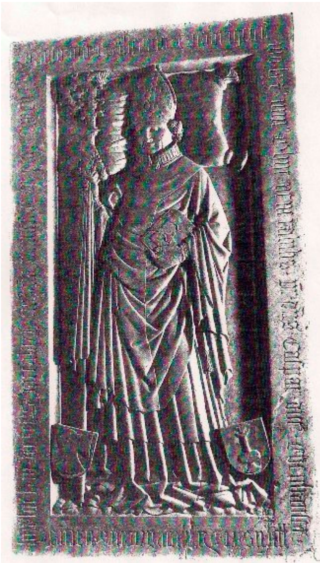
Grabstein des Baumburger Propstes Caspar Ebenhauser