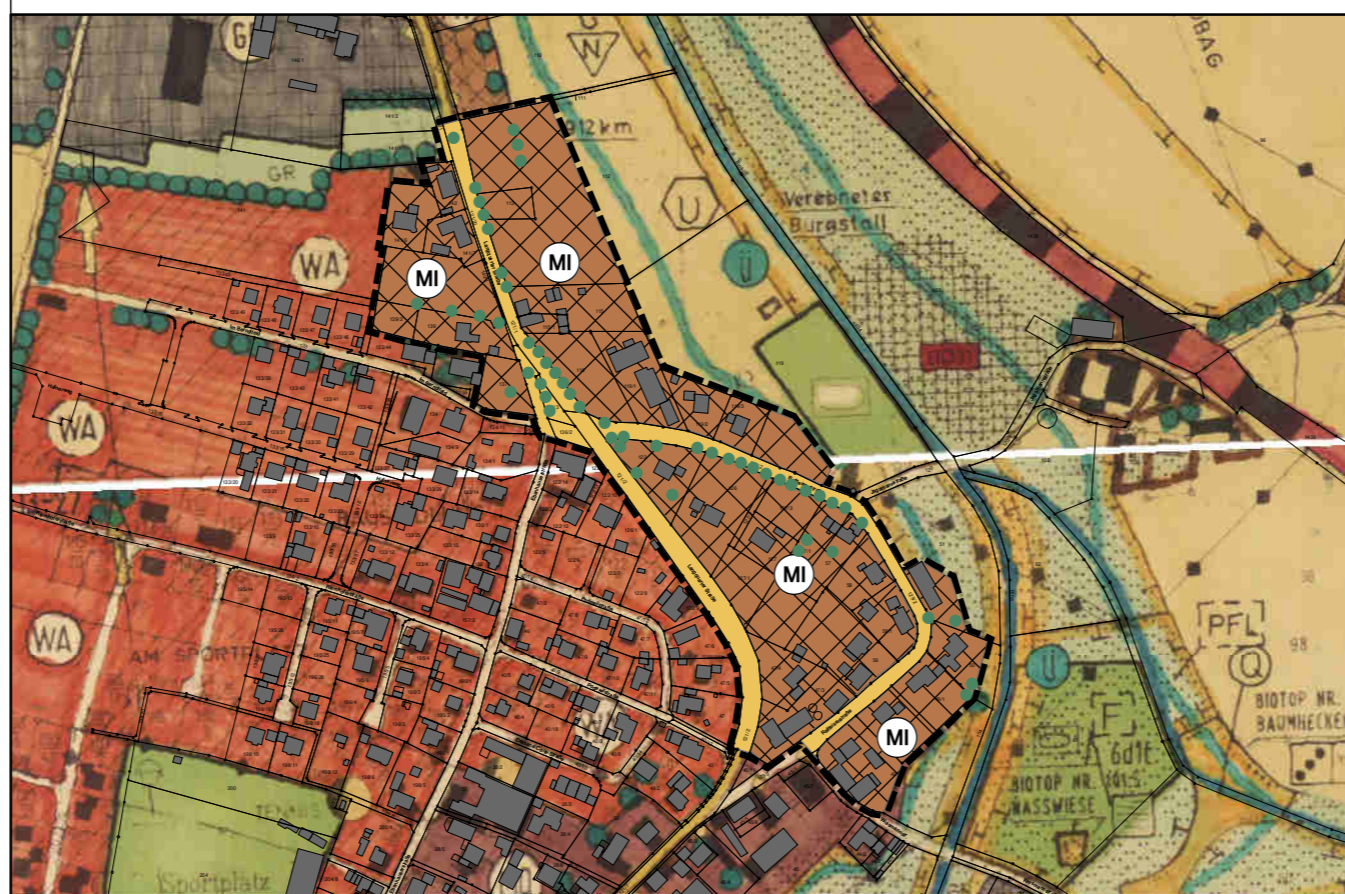
Geobasisdaten © Bayerische Vermessungsverwaltung

ORT: GEMEINDE BODENKIRCHEN – GEMARKUNG BONBRUCK M 1:5.000